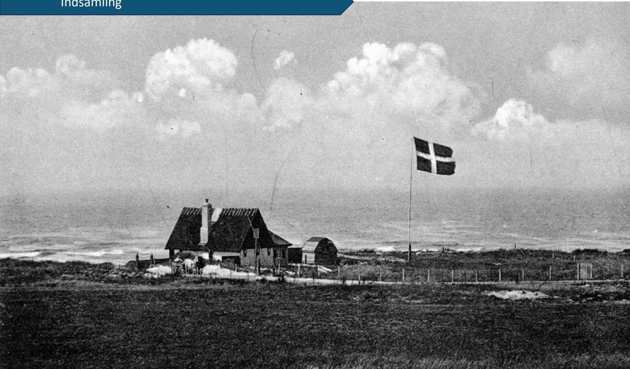
Ved Udsholt Strand