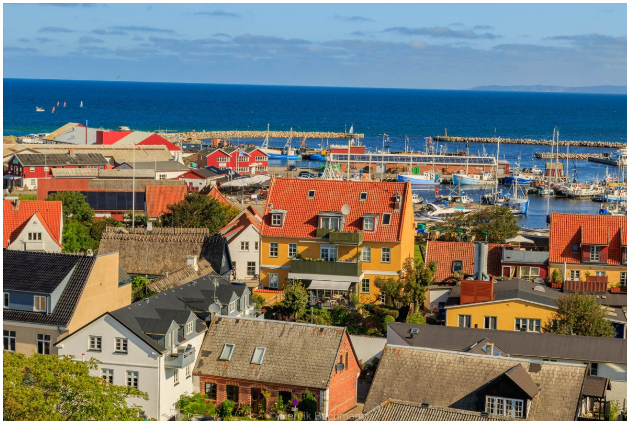
Udsigt over Gilleleje – et eksempel på foto fra en frivillig fotograf.