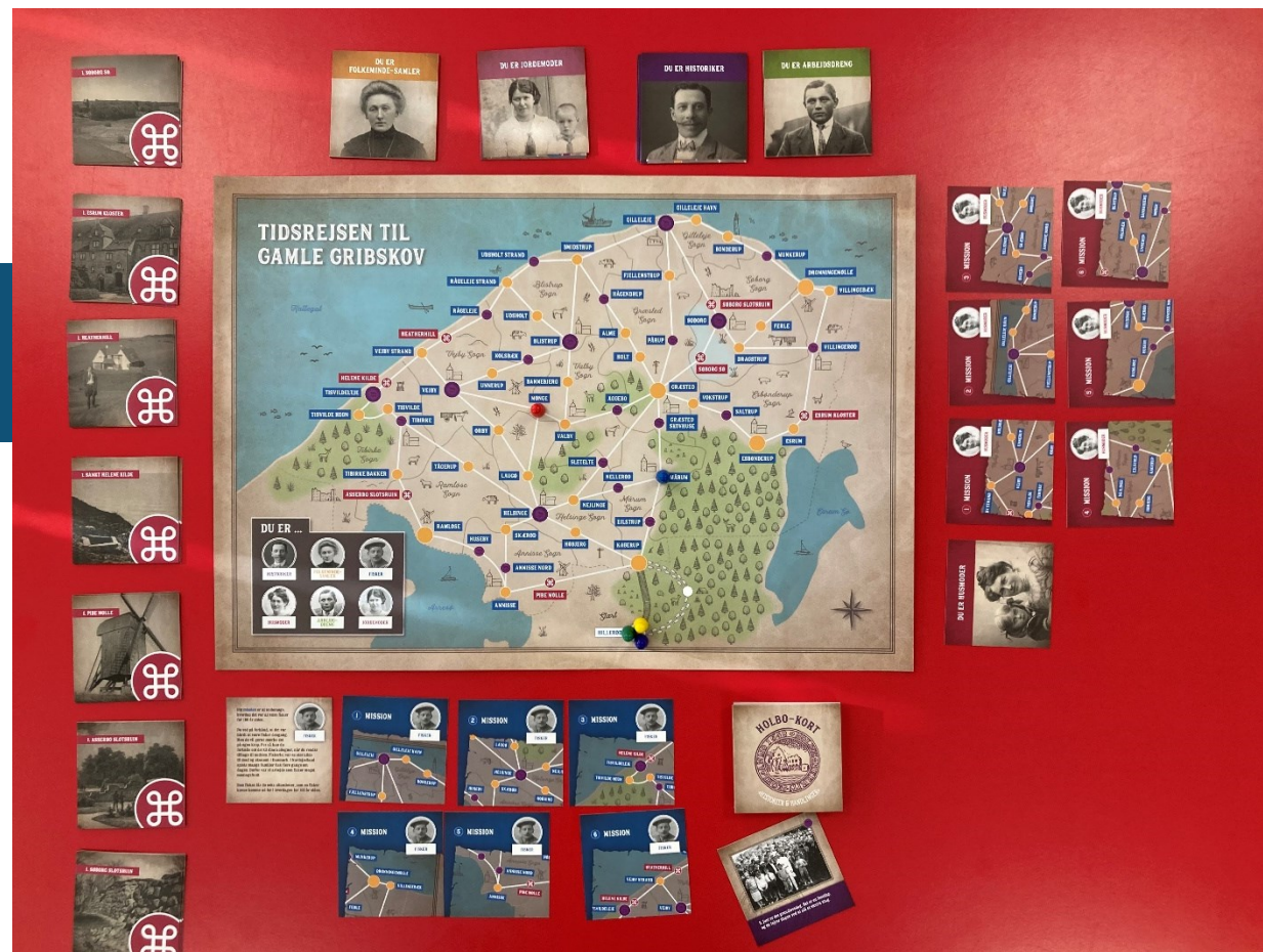
Ét af de tre lærings spil er et tidsrejse-spil, hvor eleverne skal rejse tilbage til det gamle Gribskov og udføre en række missioner.

I samarbejde Græsted Bibliotek – BLIK lavede arkivet flere arrangementer for børnefamilier i skolernes ferier. I vinterferien fortalte vi historier om de gamle fastelavnstraditioner, og børnene lavede fastelavnsris efter gamle forskrifter med silkepapirsblomster, sorte katte og storke. I efterårsferien gentog vi succesen fra 2022 med kartoffeltryk og viste billeder om forløberen til efterårsferien, nemlig kartoffelferien. Bagefter fik børn og voksne lov til at male billeder og muleposer med tryk af kartofler.