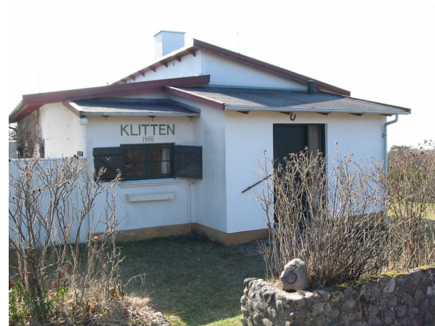
Sommerhuset Klitten, 2003

Arkivets bemandingssituation muliggør ikke yderligere aktivt opsøgende indsamling af arkivalier af privat proveniens. De frivillige fotografers fotodokumentation af kommunen udgør dog også et bidrag til indsamling af arkivalier.