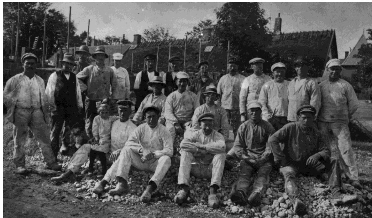
Gribskolen er Gribskov Arkivs nabo og samarbejdspartner. Her ses de håndværkere, der byggede skolen i 1921. Byggeriet, der afløste en 200 år gammel rytterskole, stod færdigt i 1922.

Vi samarbejder også med vores naboer Gribskolen og BLIK – Græsted Bibliotek, foruden Museum Nordsjælland og Naturstyrelsen om undervisning i Søborg Sø's historie samt Gribskov Gymnasium om undervisning i historieformidling.